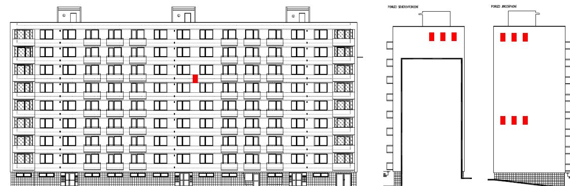
Obr. 10 Návrh umístění netopýřích budek na revitalizovaném objektu